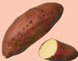
紅 赤 食用