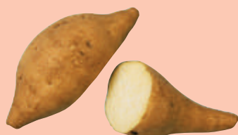
七 福 食用