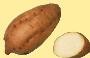
農林1号 食用 原料用