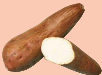
元 気 食用 原料用