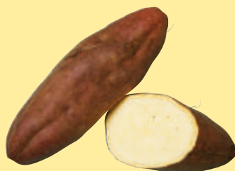
高系14号 食用 (青果用)