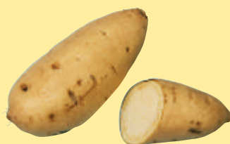
農林2号 食用 原料用