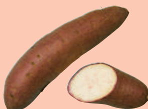
花 魁 食用