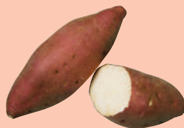
太 白 食用