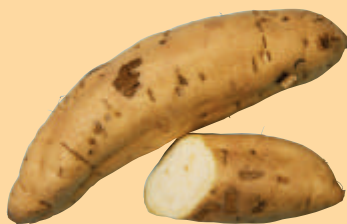
サツマスターチ でん粉