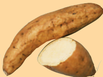
ハイスターチ でん粉