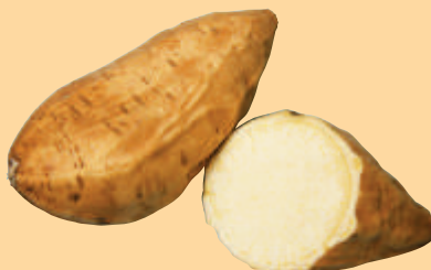
コナホマレ でん粉 焼酎