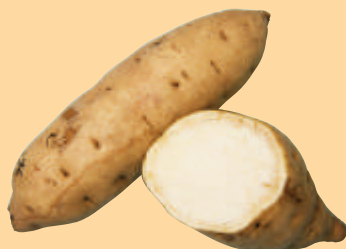
ジョイホワイト 焼酎