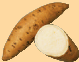
ミナミユタカ でん粉