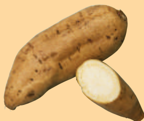
シロサツマ でん粉